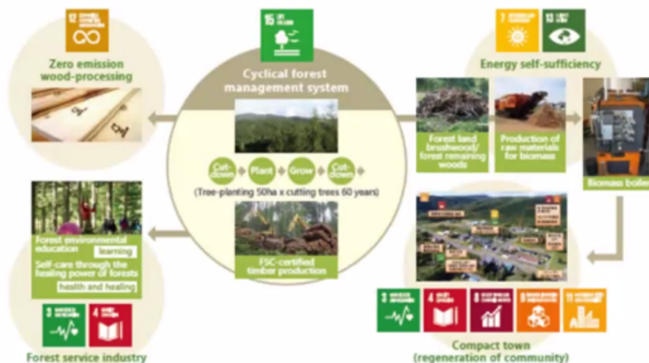
Fig. : Integrated Approach of Three Dimension of Sustainable Town Development in Shimokawa

Poleg Simokave pa se nahaja še območje Inhi-no-Hashi, kjer je bila tudi zelo izrazita depopulacija. Tu pa so se odločili privabljati start-up podjetja z iskanjem virov od znotraj. Ugotovili so, da je območje bogato z zelišči. Nova podjetja so se tako osredotočala na izdelavo in prodajo organske kozmetike, ustvarili pa so tudi laboratorije medicinskega testiranja zelišč ter začeli tudi z gojenjem gob šitaki. Uspeh tega projekta se je v 5 letih izkazal v tem, da se je povečal delež mladih, ustanovljenih je bilo 5 podjetij z 32 novimi zaposlenimi in posledično so prejeli več sredstev za nadaljni razvoj.